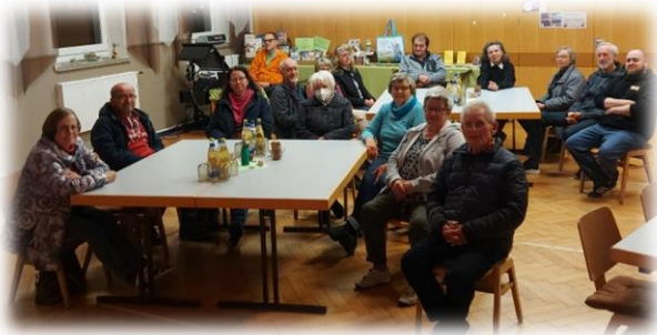
Bibleabend 23.-26. Oktober