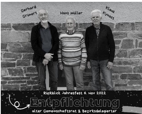
Jahresfest am 6. November