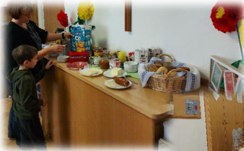
Familienfrühstück 24. September