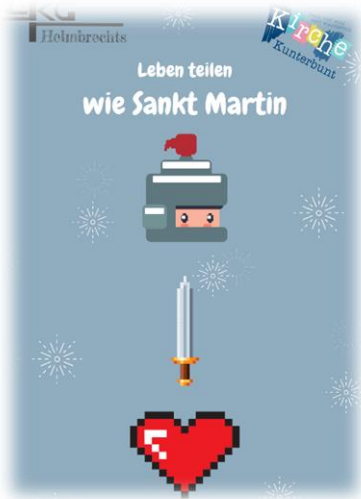
Kirche Kunterbunt 29. Oktober